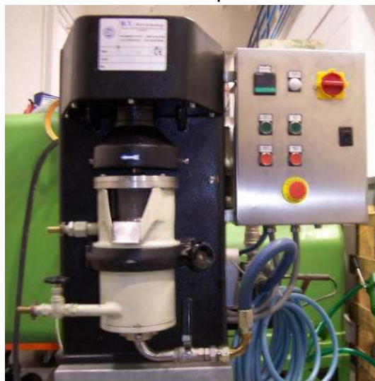
Mulino a Microsfere Tipo MS. 1