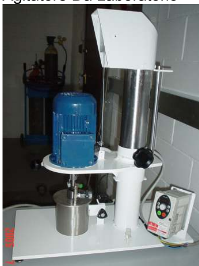
Agitatore Da Laboratorio