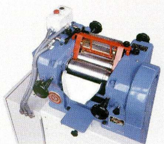
Raffinatrice da laboratorio Tre Cilindri Z0A